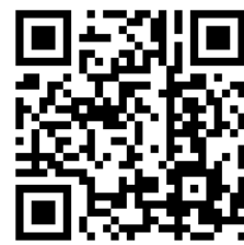
hoofdpagina Boersma Adviseurs